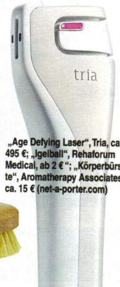
„Age Defying Laser“, Tria, ca. 495 €; „Igelball“, Rehaforum Medical, ab 2 €; „Körperbürste“, Aromatherapy Associates, ca. 15 € (net-a-porter.com)