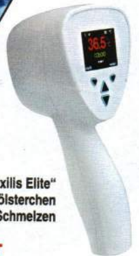
Der „BTL Exilis Elite“ bringt Fettpölsterchen zum Schmelzen